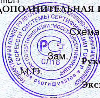
Схема сертификации За